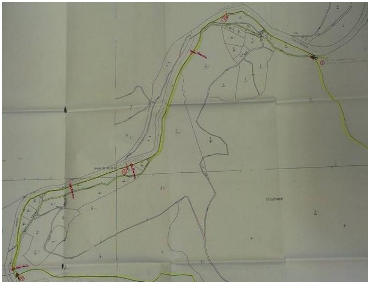
Obrázek: Vstupy do obory v Lesních Albrechticích

účelových cest, ale je nutné dbát rovněž na zachování průchodnosti přes severní a západní část obory stanovené ve stavebním povolením, kterým byla tato obora povolena, konkrétně se jedná o podmínku stavebního povolení č.j. 1472/99-Ko/Dr ze dne 3.5.2000 resp. č.j.7324/2000-Dr ze dne 22.9.2000 a kolaudačního rozhodnutí pro oborní plot ze dne 5.1.2001 pod č.j. 9967/2000-Dr, kde je stanoveno, že v oplocení u vstupu č. 1 a č. 5 (mapka viz níže) bude umístěn volný průchod veřejnosti šíře 1,5m.