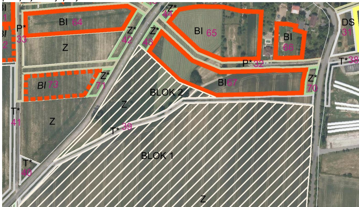
Obr.1: Rozdělení Zemědělského půdního bloku

V ploše se jedná o veřejný zájem na rozvoj technické infrastruktury obce, který v dané lokalitě převyšuje veřejný zájem na ochranu ZPF.