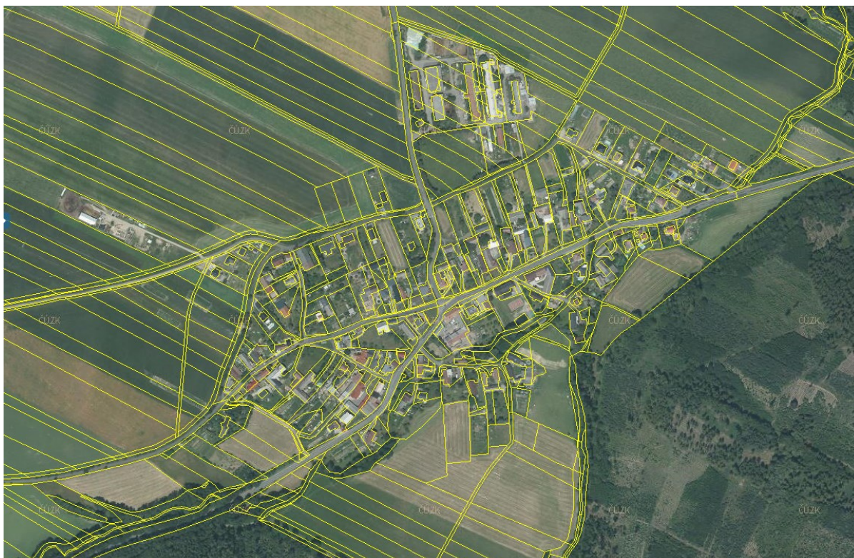
Výřez z ortofotomapy (2023)

Celé území obce je územím s archeologickými nálezy ve smyslu § 22 odst. 2 zákona č. 20/1987 Sb., o státní památkové péči, ve znění pozdějších předpisů.