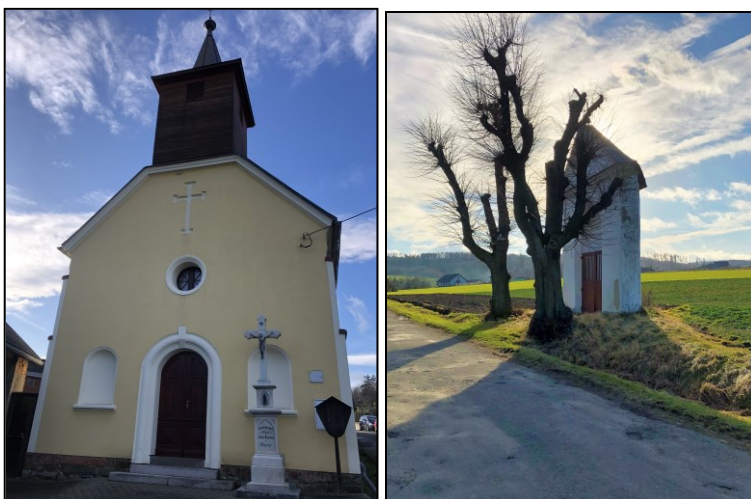
Kaple sv. Floriána a kaple sv. Anny

Na níže doloženém výřezu z tzv. Povinných císařských otisků z let 1830 – 1836 je patrné, že struktura původní zástavby obce je dosud velmi dobře zachovaná, včetně historické plužiny a je pouze v několika lokalitách doplněna novou výstavbou rodinných domů, na severní straně pak výstavbou zemědělského areálu.