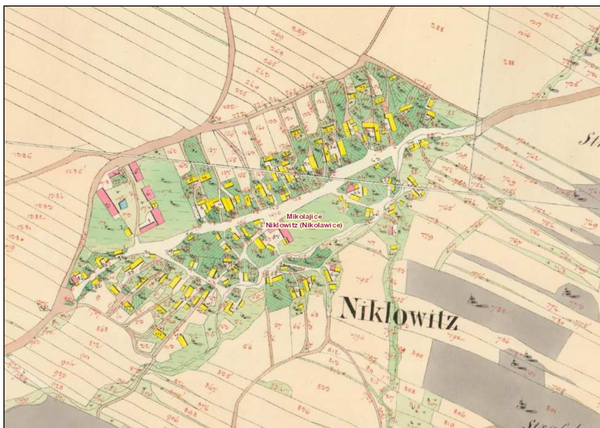
Výřez z tzv. Povinných císařských otisků z let 1830 – 1836

Na níže doloženém výřezu z tzv. Povinných císařských otisků z let 1830 – 1836 je patrné, že struktura původní zástavby obce je dosud velmi dobře zachovaná, včetně historické plužiny a je pouze v několika lokalitách doplněna novou výstavbou rodinných domů, na severní straně pak výstavbou zemědělského areálu.