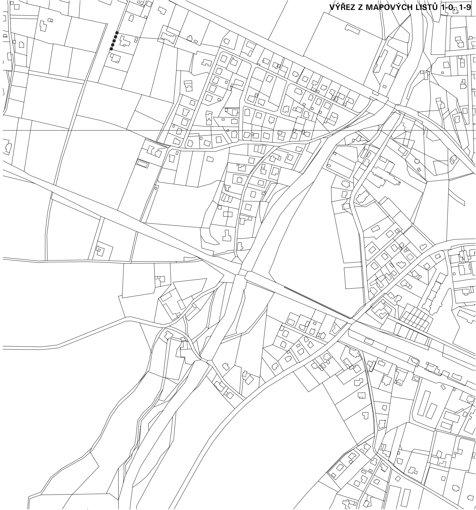
KLAD MAPOVÝCH SEKCI MĚŘITKA 1:5000