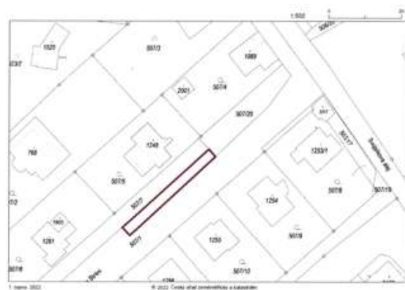
Obr. 1 Výřez z katastrální mapy Nový Jičín s vyznačením zamýšlené Změny č. 8