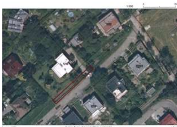
Obr. 3 Výřez ortofotomapy Nového Jičína s vyznačením zamýšlené Změny č. 8

Požadavky zadání jsou návrhem Změny č. 8 ÚP Nový Jičín splněny s tímto komentářem (psaným kurzívou):