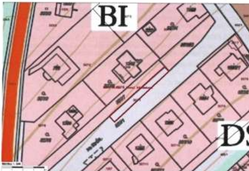
Obr. 2 Výřez z ÚP Nový Jičín s vyznačením zamýšlené Změny č. 8