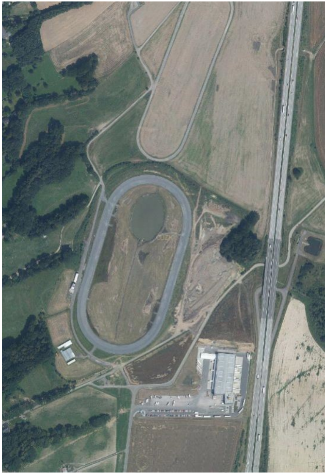
Příloha č.2 - celkový pohled na areál tělovýchovy a sportu v ploše Z13 s hipodromem, nahoře tréninkový ovál, dole plocha Z24 pro výrobu (Geis)