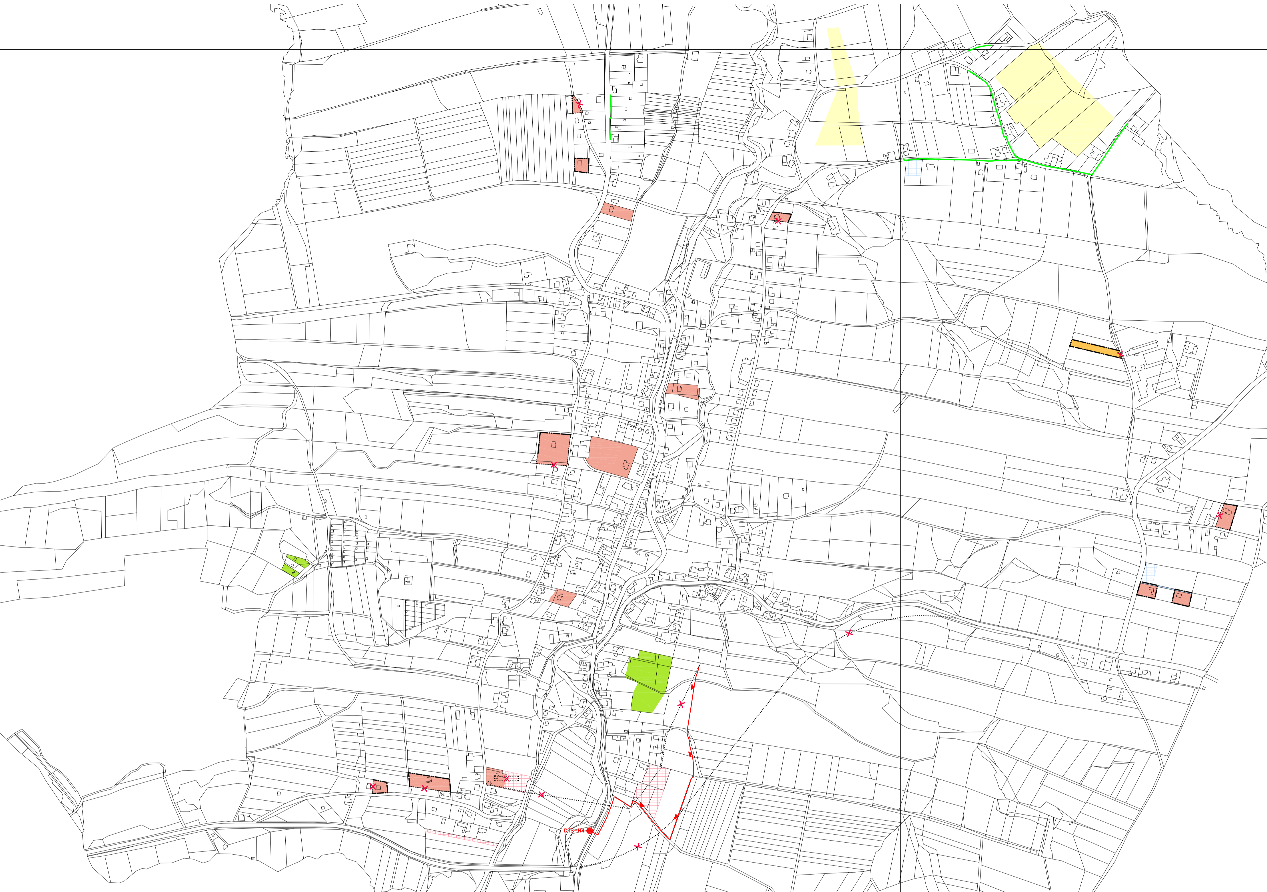
KLAD MAPOVÝCH SEKCI MĚŘITKA 1:5000