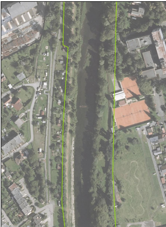
Promítnutí vymezení nadregionálního biokoridoru (zelená linie) dle Územní studie Územní systém ekologické stability Moravskoslezského kraje do leteckého snímku