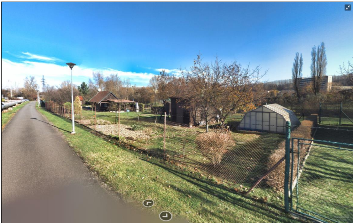
Současný stav využití dotčené lokality

Dále je provedena drobná úprava vymezení lokálního biokoridoru ÚSES5 – z plochy biokoridoru jsou vyňaty pozemky parc. č. 2307/51 a 2307/52, které jsou součástí sousedního stabilizovaného výrobního areálu.