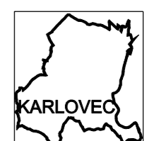
KLAD MAPOVÝCH LISTŮ 1 : 5 000