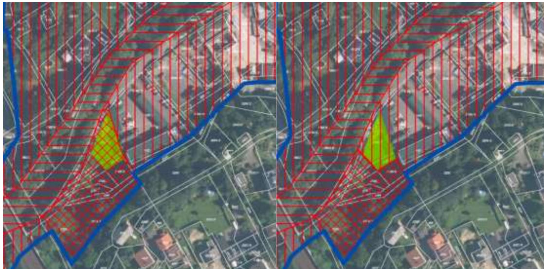
Původní vymezení nivy