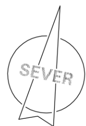
KLAD MAPOVÝCH SEKČÍ MĚŘÍTKA 1:5000 OSTRAVA