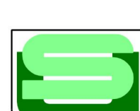
Ostrava 1-8 ÚP ČESKÝ TĚŠÍN II.B.d2) VÝKRES VODNÍHO HOSPODÁŘSTVÍ

PROJEKTOVÁ ČINNOST, URBANISMUS, ÚZEMNÍ PLÁNOVÁNÍ, EKOLOGIE URBANISTICKÉ STŘEDISKO OSTRAVA, s.r.o. Spartakovec 3, Ostrava-Poruba, 708 00 www.uso.cz tel.: 596 939530 e-mail: p.gajdusck@uso.cz