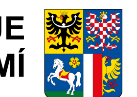
C.6: Výkres synergických a kumulativních vlivů