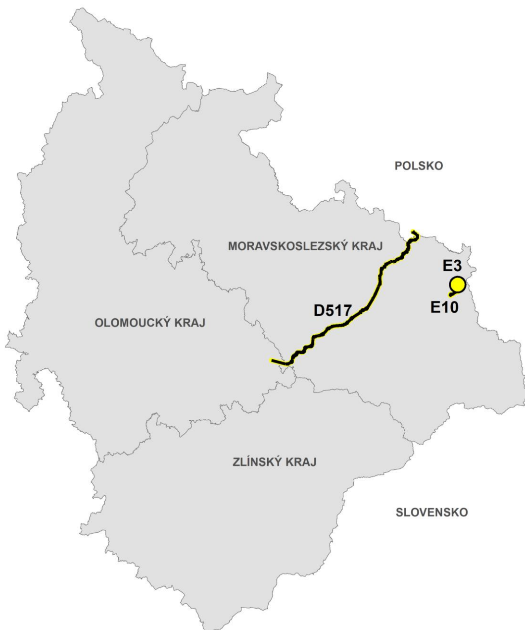
Obrázek 1: Orientační poloha rušené plochy E3, koridoru E10 a koridoru územní rezervy D517 v rámci území Moravskoslezského kraje

Vyhodnocení koordinace využívání území z hlediska širších (nadregionálních) vztahů je provedeno výhradně ve vztahu k předmětu řešení A8a ZÚR MSK. V případě rušené plochy E3 a rušeného koridoru E10 se tyto změny týkají výhradně části území Moravskoslezského kraje a nemají vliv na územně plánovací činnost v sousedních krajích ani sousedních státech. V případě rušeného koridoru územní rezervy D517 byla hodnocena koordinace s Olomouckým krajem a Polskem.